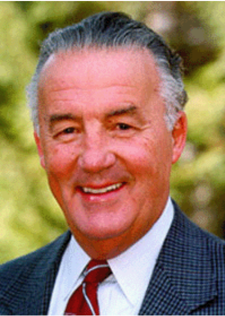
Paul Sp. Sarbanes Democrat Congress 1971 -1977 Senate 1977 -2007